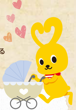
コープこうべキャラクター コ-ピー