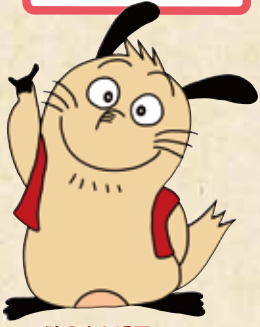
時のまち明石 マスコットキャラクター 時のわらし