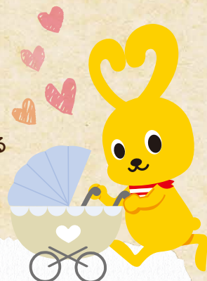
コープこうべキャラクター コーピー

※加西市からの業務委託を受けてコープこうべがかさいすくすく子育て定期便事業を行っています。